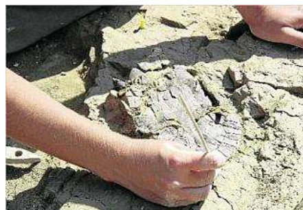
Extracció d'una tortuga de 3,5 milions d'anys l'estiu de 2007.

Es tracta de peces fabricades amb una tècnica "laminar" que correspondrien a la darrera època dels caçadors recol·lectors. Precisament en aquest període històric arrenca l'exposició Neolític. De nòmades a sedentaris, que aquests dies es pot visitar en una carpa de La Caixa a la plaça Constitució de Girona, i que explica com els homes van començar a construir ciutats per habitar-les.