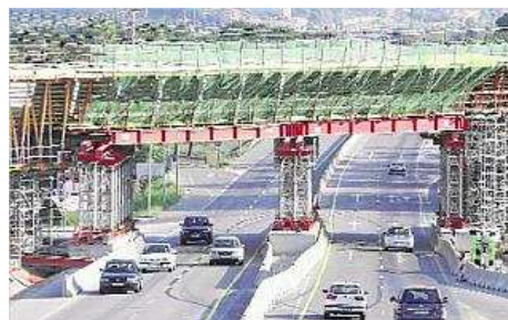
La C-66, en el tram desdoblament per Palol de Revardit, quan es feia el viaducte del TAV. marc martí

A partir de Besalú, la C-66 enllaçaria amb l'A-26 que cobreix des del municipi fins a Olot en autovia. Restaria, alhora, per acabar el desdoblament entre l'enllaç de la C-66 i l'A-26 fins a Figueres, però aquesta obra depèn del Ministeri de Foment.