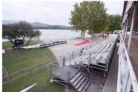
Una imatge de les graderies instal·lades a la zona del Club Natació Banyoles. marc marti

BANYOLES | DDG Banyoles tornarà a ser aquesta setmana el centre d'atenció del rem amb la celebració del Campionat del Món de Marató i de la Copa del Món de Piragüisme, que reuniran més de 800 regatistes d'una trentena de països.