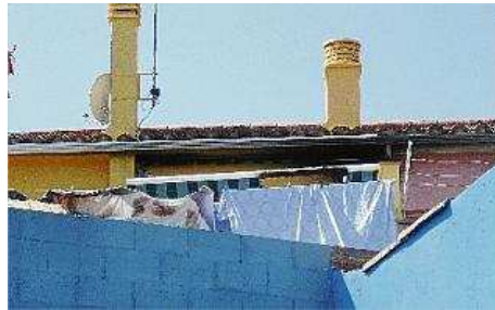
diari de girona

Una explosió va sotraguejar ahir a les quatre de la matinada la casa on viu confinada, sota custòdia policial a causa de les amenaces de l'exparella, una dona de 28 anys veïna de Llagostera. Algú va llançar, per la part de darrere de la finca, un còctel Molotov que va caure a una terrassa i va encendre un tendal. En intentar apagar les flames, el pare i el germà de la noia van patir cremades -al pit i a l'esquena en cas del pare, als braços en el cas del noi-. L'explosiu va caure a prop d'una piscina infantil plena d'aigua i una veïna va fer passar una mànega des del balcó del costat. Per això es va poder apagar l'incendi abans que arribessin els bombers. Cap veí va veure res i tan sols uns gossos van bordar uns instants abans de l'explosió, probablement en sentir un vehicle que s'acostava.