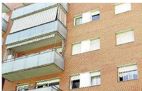
La dona es va precipitar per la façana posterior d'un edifici del carrer Provença, a Blanes.