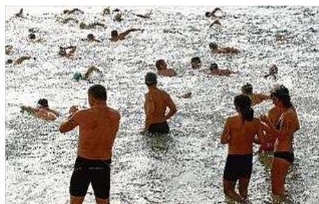
Moment de la sortida de l'edició d'enguany de la Travessia Popular del Port de Blanes.