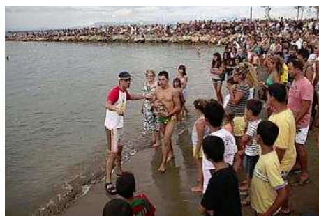
Un participant que ha arrellegat un ànec surt de l'aigua, enmig de l'expectació general. jordi velasco

Mentrestant, la Festa Major continua avui, amb l'entrega dels Dracama de Plata -reconeixement a la tasca de persones o col·lectius a favor de la vila de Roses- i els correbous, que enguany s'emmarquen enmig de la polèmica per la prohibició de les corrides de toros.