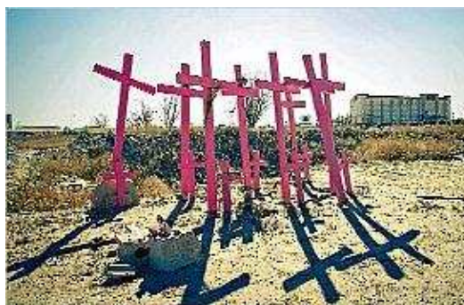
Les tristament famoses creus de Juárez recorden les dones mortes.