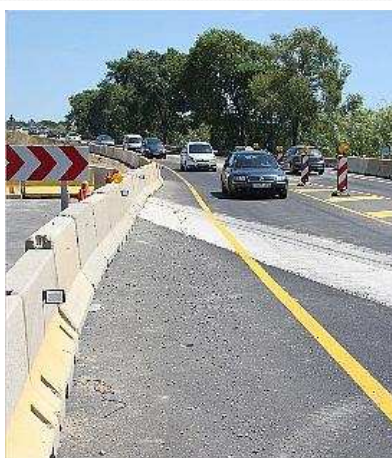
Punt de la C-31 en què es va produir l'accident mortal.

En les tasques d'assistència a l'accident, hi van participar diverses dotacions dels Mossos d'Esquadra, dels Bombers de la Generalitat i dels serveis sanitaris.