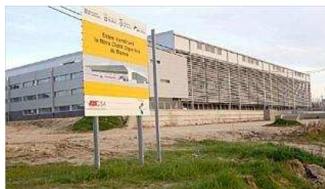
L'estudi tècnic aprovat detalla les finques municipals, la venda de les quals serviran per pagar el préstec. carles colomer

Blanes va aprovar en el darrer ple municipal un estudi tècnic, ?elaborat conjuntament per arquitectes de l'Ajuntament i de la Generalitat, que detallen diverses finques de titularitat municipal que aniran destinades a pagar el préstec, per valor de 30 milions d'euros, que l'Institut Català de ?Finances va avançar al consistori per construir la Ciutat Esportiva.