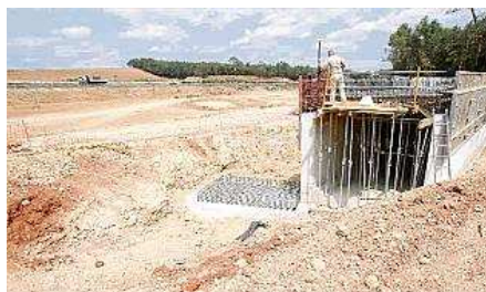
Les obres de l'A-2 desertes a Vilafreser i la N-II antiga al fons marc martí

GIRONA | JOFRE SÁEZ Projecte de N-II que arrenca, projecte de N-II que s'atura. El Ministeri de Foment ha estat incapaç de finalitzar cinc dels sis desdoblaments iniciats a les comarques de Girona des que el 1993 Josep Borrell va proposar convertir aquesta vella carretera en una autovia. L'únic tram que fins ahir estava en marxa és el que va de Medinyà a Oriols. Un projecte que es va iniciar set mesos després d'adjudicar-se (novembre de 2009) i que vuit mesos després ha estat abandonat a causa de les necessitats de l'Estat per reequilibrar el pressupost.