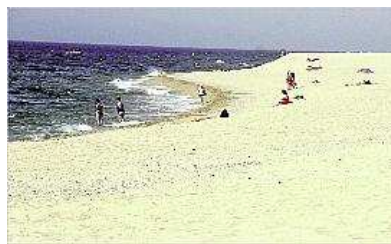
La platja de Santa Susanna, on se celebrarà el festival Pride 2010.

El Pride 2010 se celebrarà entre el 16 i el 18 de juliol a la platja de Santa Susanna, a tocar del terme municipal de Pineda. Divendres es farà una festa a la discoteca ?Desigual de Santa Susanna i, el cap de setmana, la música es traslladarà íntegrament a la platja.