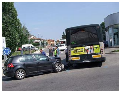
La topada d'ahir a Olot. x.v.