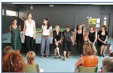
"title="Moments previs a l'estrena de l'obra "Fora d'hora", a Banyoles." "border="0" align="right">