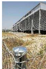
El pavelló de la Ciutat Esportiva. aniol resclosa

La intenció del consistori, per tant, seria que en ser una zona de sòl municipal, llogar els terrenys i, per tant, del resultat econòmic d'aquesta àrea comercial poder ajudar l'Ajuntament de Blanes o bé a pagar el cànon de la Ciutat Esportiva o, fins i tot, a construir nous equipaments esportius, com a ara una piscina per a la població, que és un dels altres projectes insígnia de la Ciutat Esportiva.