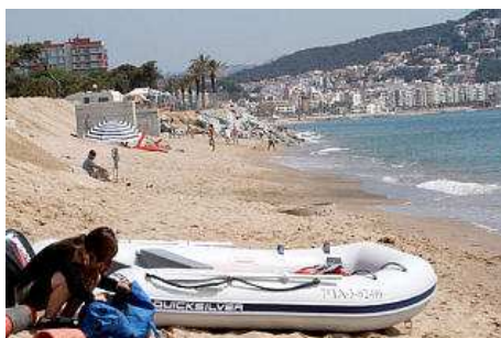
La zona afectada per Costes és la part dels càmpings de S'Abanell. diari de girona

Tot i la decisió de l'ajornament, el procés continua endavant. "Simplement és un ajornament, però l'expedient segueix", va comentar el representant dels càmpings. Des de Blanes, però, es vol intentar reduir la zona afectada, ja que es creu que és excessiva. "L'ajornament ens permetrà a tots plegats plantejar noves propostes i arguments perquè l'aturnament pugui ser més a prop del mar", va afirmar Celaya. "El projecte que es planteja ara entra molt endins i ocupa molt d'espai, intentarem buscar arguments perquè pugui estar més a prop del mar", va afegir Celaya. El representant dels càmpings va expressar que es va sentir recolzat en tot moment per l'Ajuntament i la Generalitat.