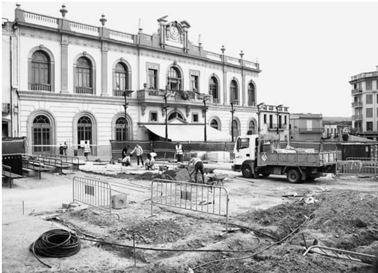
La plaça de Catalunya de Llagostera, actualment en obres.

El portaveu del PSC, Jesús Torrent, afirma que l'equip de govern no els in-