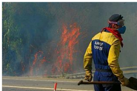
L'objectiu és evitar que les flames destrossin els boscos gironins.

Alt risc de foc i tota precaució és poca. El delegat del Govern de la Generalitat, Jordi Martinoy, va reunir-se ahir amb els principals actors que aquest estiu s'hauran d'encarregar de vetllar perquè les flames no destrossin els boscos gironins i ja va avançar algunes de les línies mares del que serà el pla antifoc estiu 2010. Les restriccions per accedir amb vehicle o dur a terme determinades activitats en espais d'alt risc són el principal punt d'un programa que té molt en compte l'estat en què estan els boscos després de les nevades d'aquest estiu.