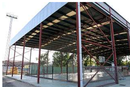
La pista poliesportiva de Caldes, que s'haurà de tancar pels costats. carles colomer

Luque va explicar que en els darrers anys han augmentat molt les entitats esportives i calia fer una nova infraestructura. Ara mateix, però, va apuntar que el consistori no es pot permetre la construcció d'un pavelló, però aquest projecte és una solució temporal a les demandes de les entitats. "Tenim un pavelló petit i en els darrers anys han augmentat molt les entitats esportives de Caldes, per tant, vam veure que hi havia una necessitat de fer un nou pavelló. Ara bé, la construcció d'un nou pavelló tancat val molts diners i en la situació que ens trobem és inviable i per això vam pensar en aquesta opció", va afirmar Luque.