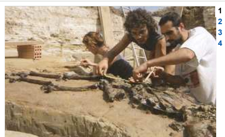
Detall de les excavacions del Camp dels Ninots.

Després d'un cicle de conferències i una exposició itinerant, El Camp del Ninots. Rastres de l'evolució , llibre editat per l'Ajuntament de Caldes de Malavella i l'Institut Català de Paleocologia Humana i Evolució Social (IPHES), representa un pas més en el conjunt d'accions que es duen a terme per donar a conèixer un dels jaciments paleontològics més valuosos a Europa. L'equip científic encarregat de les excavacions i els autors d'aquest llibre han recopilat una sèrie de línies d'investigació l'objectiu de les quals és presentar els resultats sobre el passat del Camp dels Ninots i també les perspectives que es volen assolir en el futur.