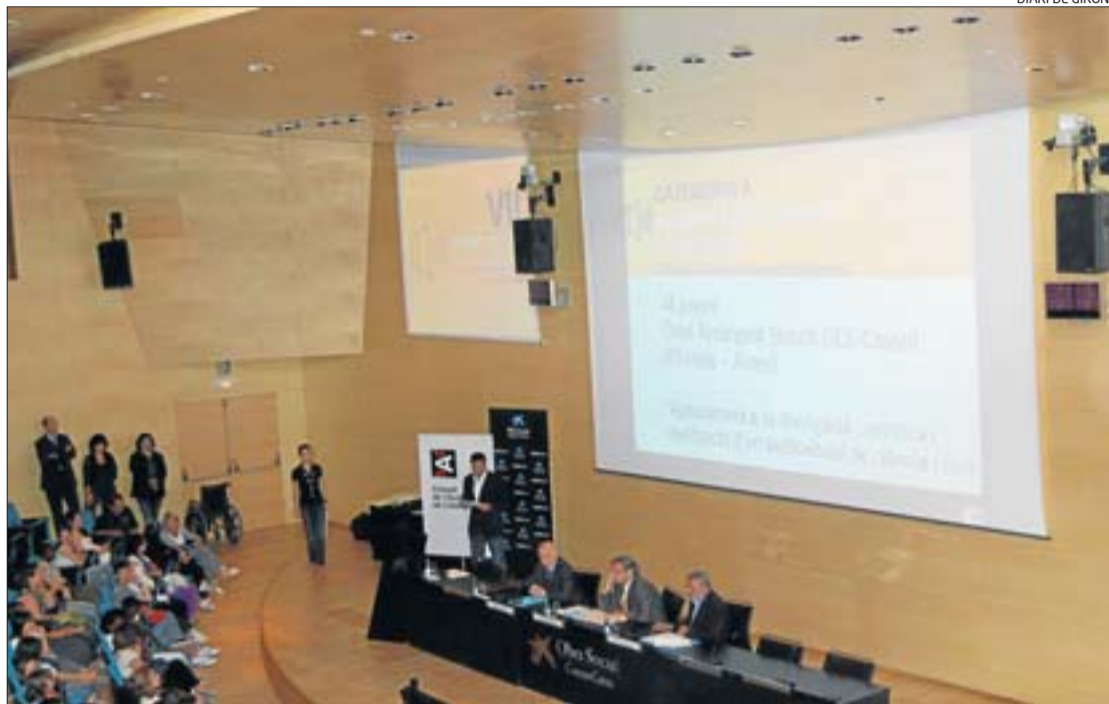
L'entrega de premis d'ahir, en el moment en què s'atorgava un guardó a un alumne de l'institut d'Amer.

En la categoria de centres educatius i en el nivell corresponent a educació infantil i cicle inicial de primària, el CAC ha guardonat l'escola Josep Dalmau Carles -de Girona- amb un segon premi pel treball La ficció: curts, animacions i trucs de càmera ; i el col·legi de Bordils amb un tercer per Història de l'escola: entrevistes . Al cicle mitjà i superior de primària, l'escola Josep