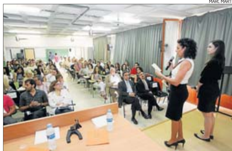
La presentació d'un dels projectes d'empresa a l'institut Montilivi.

Els projectes de creació d'empreses dissenyats pels estudiants d'Administració i Finances de l'institut Montilivi són el resultat d'un treball que pretén integrar els coneixements adquirits durant el cicle. A més, els treballs han de con-