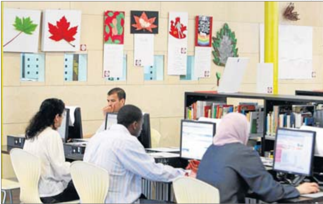
Les creacions dels estudiants es van exposar la setmana passada a la Biblioteca de la Coma Cros.