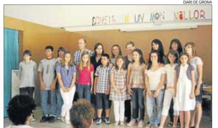
Els guanyadors del concurs d'oratòria de la Fundació Riera Gubau.

La Fundació catalana per a l'ensenyament de la llengua anglesa i de l'educació en anglès, la qual gestiona el Fons Joan Riera Gubau, vol impulsar aquest concurs com una eina més que incentivi l'aprenentatge de la llengua anglesa entre els alumnes de Santa Coloma de Farners i la comarca de la Selva.