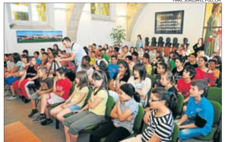
La sala de plens de l'Ajuntament de Llagostera es va omplir d'alumnes.

Actuant com a regidors, l'alumnat va plantejar un ampli ven-