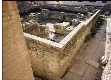
termes romanes. El projecte per cobrir-les i regenerar l'entorn costa al voltant de 800.000 euros.