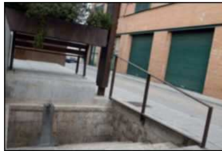
fontes. L'aigua és un dels patrimonis històrics i culturals del municipi.