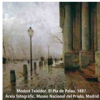
Modest Teixidor. El Pla de Palau, 1887. Arxiu fotogràfic. Museo Nacional del Prado, Madrid