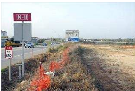
El tram de Maçanet-Sils es troba aturat fa més d'un any, en una imatge d'arxiu.

El fet és que aquest canvi de data ha deixat sorpresos ambdós batlles i, de fet, ahir es preguntaven si no és que en dues setmanes s'esperen notícies referents a la futura A-2 i, per això, se'ls ha canviat el dia. A la reunió prevista el que reclamaran són dates concretes d'execució i no aproximades com fins ara.