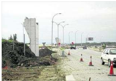
S'ha aplanat el lateral de la N-II a l'alçada de l'encreuament de Caldes, per eixamplar la carretera. carles colomer

Després de tenir durant més de mig any les obres aturades, l'Estat ha començat a treballar en actuacions de millora de la seguretat de la futura autovia A-2 en el tram que va de Caldes de Malavella fins a Sils, un dels dos trams que té paral·litzats a la comarca de la Selva. Aquestes millores són una reclamació explícita dels ajuntaments de Caldes de Malavella i Sils, que veuen com després de tenir el desdoblament de la N-II aturat durant set mesos, la carretera es troba igual que mentre s'hi feien obres i amb el perill d'accidentalitat que això pot suposar. De moment, les obres de millora que ha s'han iniciat són les que pertanyen a Caldes de Malavella, si bé ahir també ja es podia veure maquinària preparada a l'alçada del Rols, en terme municipal de Sils. En concret, el que s'ha iniciat a Caldes és l'eixamplament de la carretera N-II a l'alçada de l'encreuament de Caldes de Malavella, i és que ahir hi havia una màquina que aplanava el lateral de l'actual carretera preparant el terreny. Aquesta és una actuació que ha de permetre per una banda, millorar tant la sortida com l'entrada de l'encreuament i una millor seguretat en la incorporació al carril cap a Caldes. Alhora, com explicava l'alcalde, Joan Colomer (PIC), també s'hi instal·laran unes bandes reductores i es pintaran les línies de la via, que gairebé ni es veuen. Un altra zona on ja s'ha actuat és a l'entrada de la urbanització Tourist Club, millorant-ne l'accés.