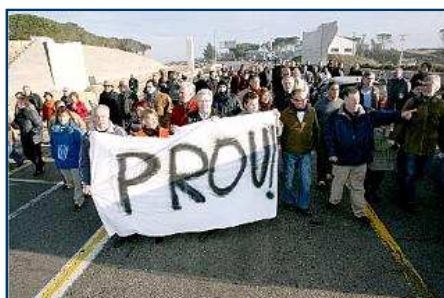
" title="El centenar de manifestants parapetats darrere una pancarta que duu escrit "Prou" tallant la carretera. " border="0" align="right">