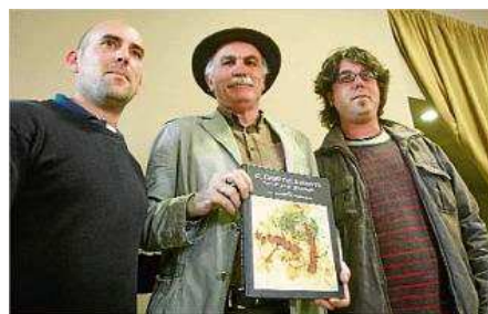
La presentació es va fer ahir a la tarda a Caldes de Malavella. diari de girona

S'estudia l'evolució climàtica i paisatgística dels darrers 3,5 milions d'anys, i les empremtes vegetals que permeten reconstruir el paisatge del Camp dels Ninots, un paratge que es repetiria en gran part del mediterrani europeu. També s'estudien les eines de pedra localitzades als nivells superiors del cràter volcànic del jaciment.