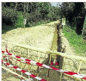
La via verda de Llagostera durant l'obra, la setmana passada.

Santamaria va comentar que l'Ajuntament de Llagostera ha hagut d'actuar amb la "màxima celeritat" per poder facilitar els permisos d'obra. El projecte, que ja està gairebé finalitzat, es va finalitzar diumenge i ara només restaria reforçar el ferm tocat de la via verda.