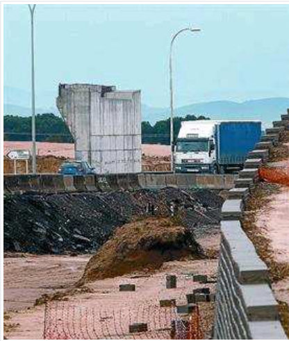
Treballs a mig fer a la N-2 a Caldes de Malavella, al març.