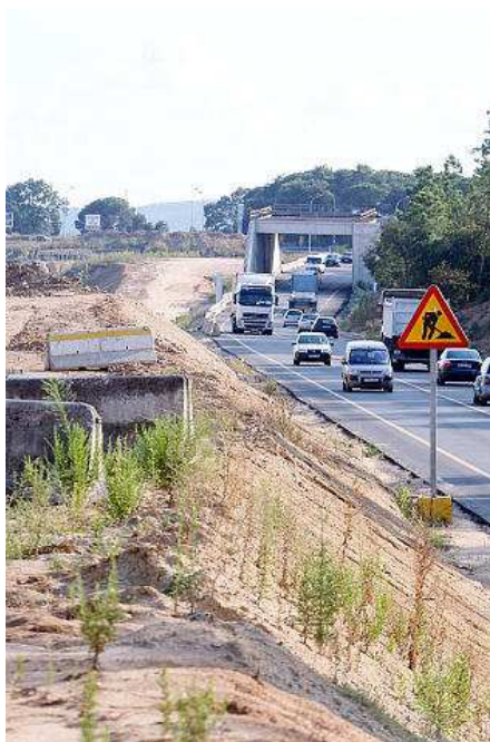
Les obres autrades a la N-II al seu pas per Caldes de Malavella. diari de girona

Des del Ministeri de Foment van explicar que de moment no s'ha concretat quins projectes es tiraran endavant. Se seleccionaran tenint en compte que siguin rendibles pel que fa a la societat, el medi ambient i l'economia. Un dels requisits és que han d'estar en un avançat estat de tramitació.