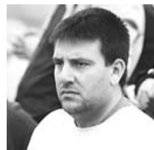
LA ZONA BAIXA. No és gens fà-

DE MENYS A MÉS. Fa deu partits que no podem i, tot i això, no estem salvats. És cert, però, que podem veure les coses de més bon ull que fa uns mesos. Vam començar la lliga amb 9 derrotes en els 12 primers partits, però també es podia preveure que amb el pas de les jornades molts jugadors i jo mateix, que no teníem experiència a tercera, ens aniríem adaptant a la categoria. La tossuderia de la plantilla ha estat clau per no perdre la fe, i el primer partit de la segona volta, l'1-2 a Sant Boi, ens va servir per creure en nosaltres mateixos. Ens falta, però, fer un últim esforç.