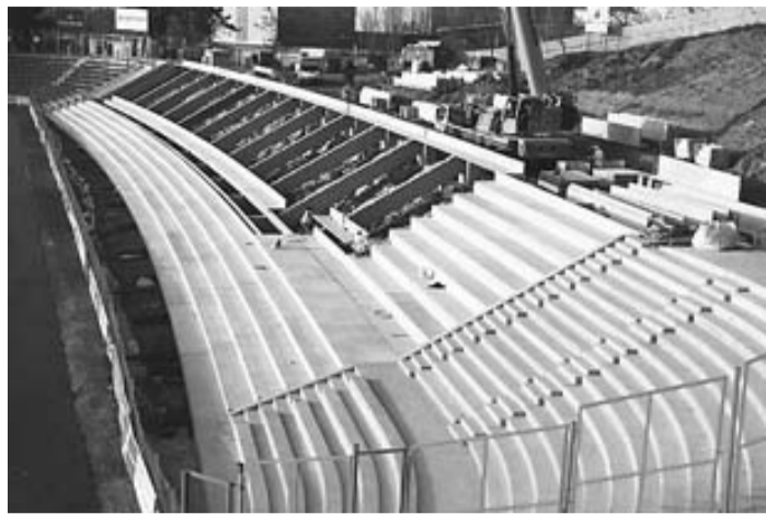
Una imatge de la graderia, ahir a la tarda.