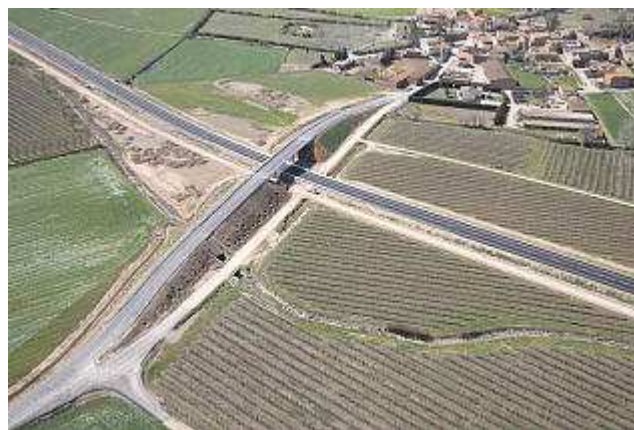
El tram finalitzat de la C-31, entre la Tallada d'Empordà i Vilamacolum. departament de política territorial

D'altra banda, el conseller també va confirmar que el desdoblament de la N-II al voltant de Girona -vinculat als quatre carrils de l'AP-7 en aquesta zona urbana- ja ha estat adjudicat i que hi ha pendent de licitació el tram Tordera-Maçanet de la Selva, amb un cost de 263 milions d'euros.