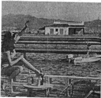
Canal de l'obra de Pesca i maridat. © Tònic i els dipòsits submergits i pilars.

Sólo en Florida le pueden ofrecer algo parecido