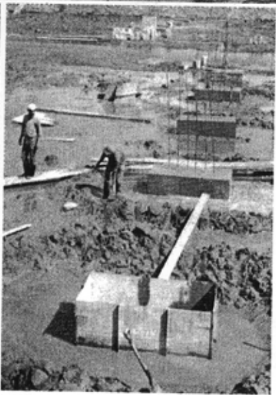
Imatges de la construcció dels canals, dels fullets promocionals i dels primers passos de urbanització.