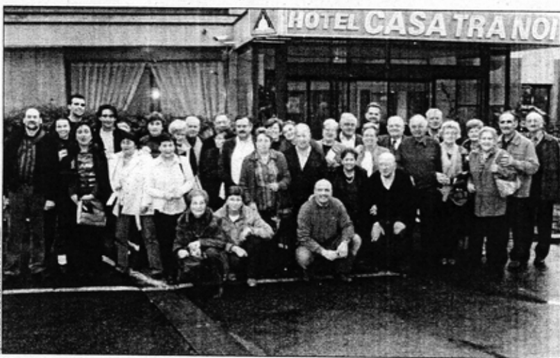
La imatge davant la porta de l'Hotel Casa Tra Noi va ser presa l'últim dia d'estada dels castellanins a Roma