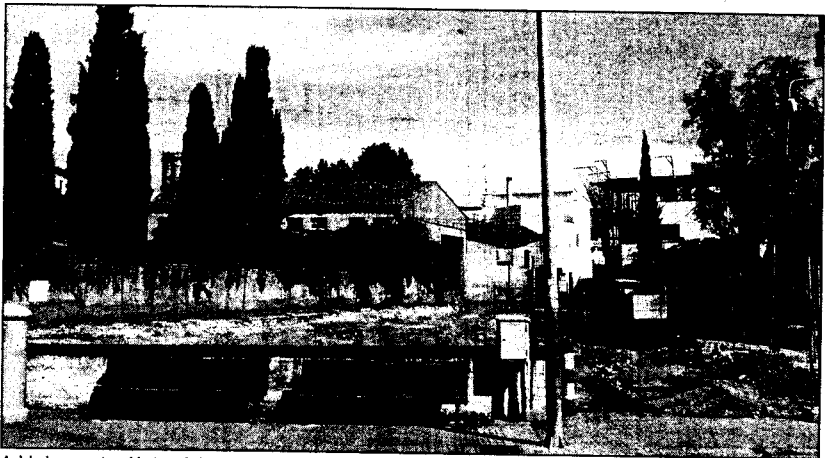
A dalt, les noves instal·lacions de la cooperativa. A baix, el solar que ha quedat després d'enderrocar l'antiga seu