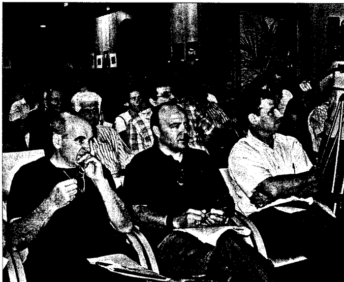
Veïns de Castelló d'Empúries durant un ple municipal

Si els castellonins van ser els primers en adonar-se i demostrar que la força veïnal és capaç de modificar un planejament aprovat inicialment en un Ple municipal, a Vilanova de la Muga, i tot seguit a Peralada, es van apuntar a la moda de les pancartes i han deixat el poble decorat amb originals rodolins. Tant els uns com els altres van assistir al Ple municipal com a mesura de pressió, però mentre que els primers han aconseguit ampliar el període d'exposició pública del projecte i introduir canvis en el planejament inicial, els peraladencs només compten amb un informe dels tècnics on s'exposen una sèrie de punts a reconsiderar per part de l'equip de govern, però sense que encara s'hagi arribat a cap conclusió definitiva.