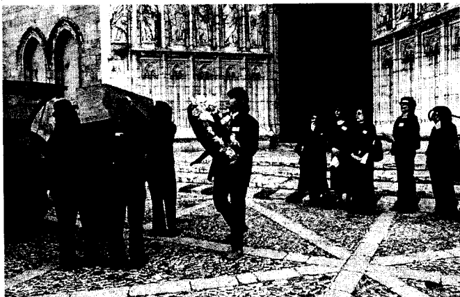
Una acció de Salvem l'Empordà el 22 d'abril passat, a Castelló d'Empúries.

Segons han explicat des del Departament de Política Territorial i Obres Públiques, la comissió d'Urbanisme tornarà a partir de l'aprovació inicial del pla territorial de l'Empordà els plans generals dels municipis que incompleixin els aspectes més essencials d'aquest document. Fins ara, la comissió ja el tenia en compte en aspectes concrets com ara creixements urbanístics desorbitats, però amb l'aprovació inicial el filtre serà molt més sever. De fet, en tractar-se d'un pla territorial la llei no permet fer una suspensió de llicències, tal com havien demanat entitats de defensa del territori. Un cop el pla estigui aprovat definitivament —que si tot segueix el procés previst es calcula que serà a finals d'aquest any—, ja hauran de ser els ajuntaments els que l'hauran d'incloure en la redacció dels seus nous planejaments urbanístics. En canvi, els plans generals que ja hagin estat revisats per Urbanisme no s'hauran de refer per incorporar-hi els criteris.