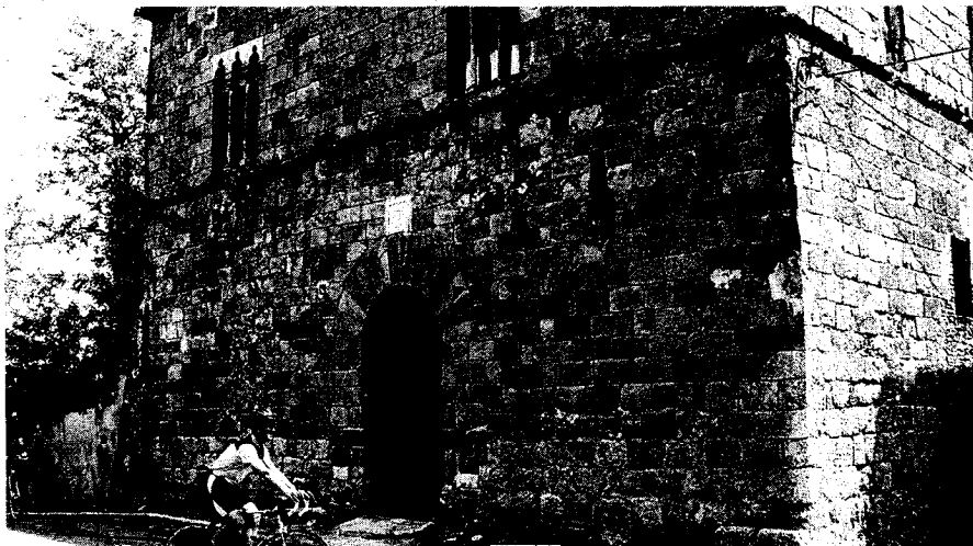
La Casa Gran és probable que acabi sent la seu del futur museu d'història local / ROBERT CARMONA