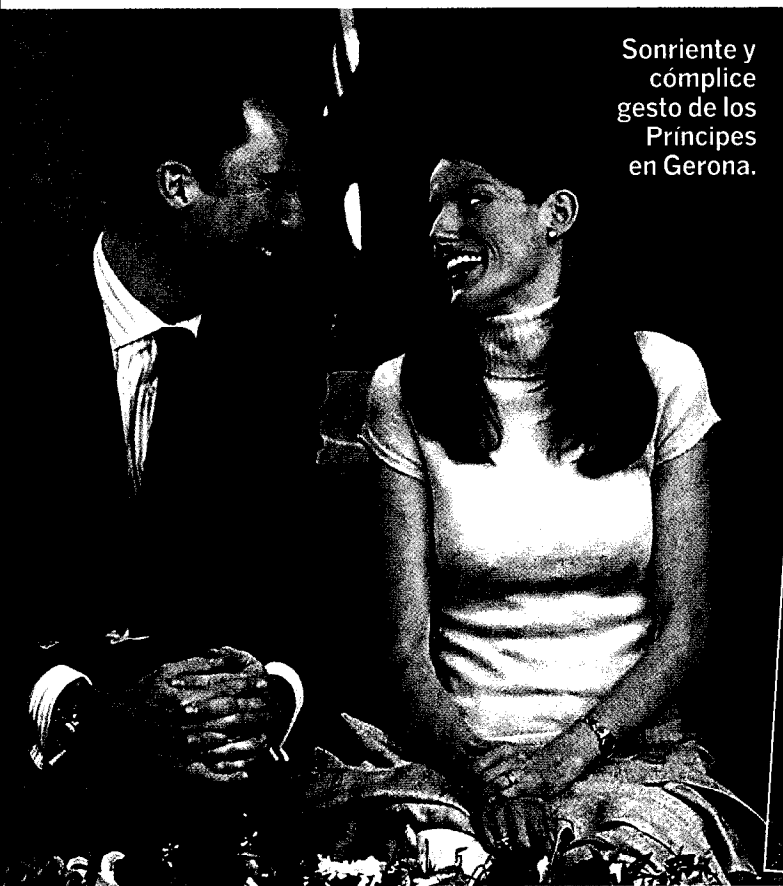
Sonriente y cómplice gesto de los Príncipes en Gerona.