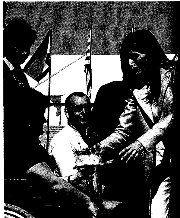
Letizia recibió este bonito ramo de flores.

El saludo de la pareja real desde el balcón del pueblo gerundense de Castelló d'Empuries.