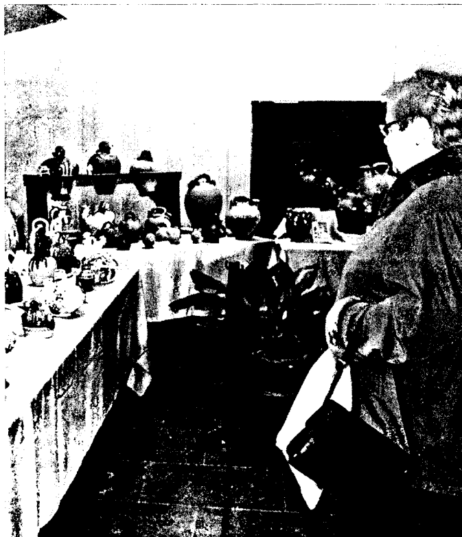
Amb motiu de la festa, la Sala Gòtica va acollir una exposició de càntrics

Finalment, el guardó de bronze, que recau sobre la figura d'un destacat esportista, va correspondre en aquesta ocasió a Salvador Canet, campió de diverses competicions de motos aquàtiques, tant d'àmbit estatal com català.