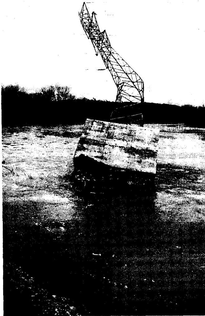
La torre d'alta tensió descalçada al costat del Fluvià, entre Garrigàs i Vilaür, que va ser substituïda ahir.

Els treballs al costat de la torre afectada es van aturar ahir a la nit després de trenta-hores sense interrupció. «Ara ja hi ha garantit el subministrament, que era la prioritat, i això s'ha fet com era previst, però aquesta és una solució provisional i ara hem de buscar la solució definitiva», explicava el portaveu de Fecsa-Endesa, Oriol Losan. Durant tota la nit a la zona s'hi van quedar un grup d'operaris de guàrdia per solucionar qualsevol problema que pogués sorgir.