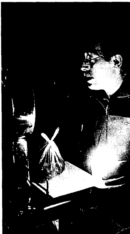
Espelmes, llanternes i gent fora dels establiments van ser una imatge habitual.