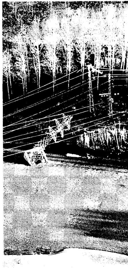
A dalt i a la dreta, una imatge aèria de la torre afectada al costat del Fluvià i, a sota, una botiga de Castelló d'Empúries amb espelmes i una dependenta posant un cartell en un establiment d'una superfície comercial de Figueres en què s'indica que es tanca per falta d'electricitat.