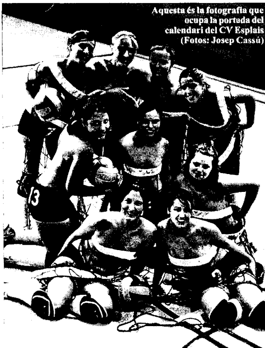
Aquesta és la fotografia que ocupa la portada del calendari del CV Esplais

Nou de les catorze jugadores del sènior femení del CV Esplais surten pràcticament despullades en un calendari que elles mateixes han posat a la venda -a un preu de 10 euros- a diversos establiments de Castelló d'Empúries i Sant Pere Pescador. L'objectiu d'aquest grup de noies no és cap altre que el de reunir uns 7.000 euros per ajudar a fer front a les