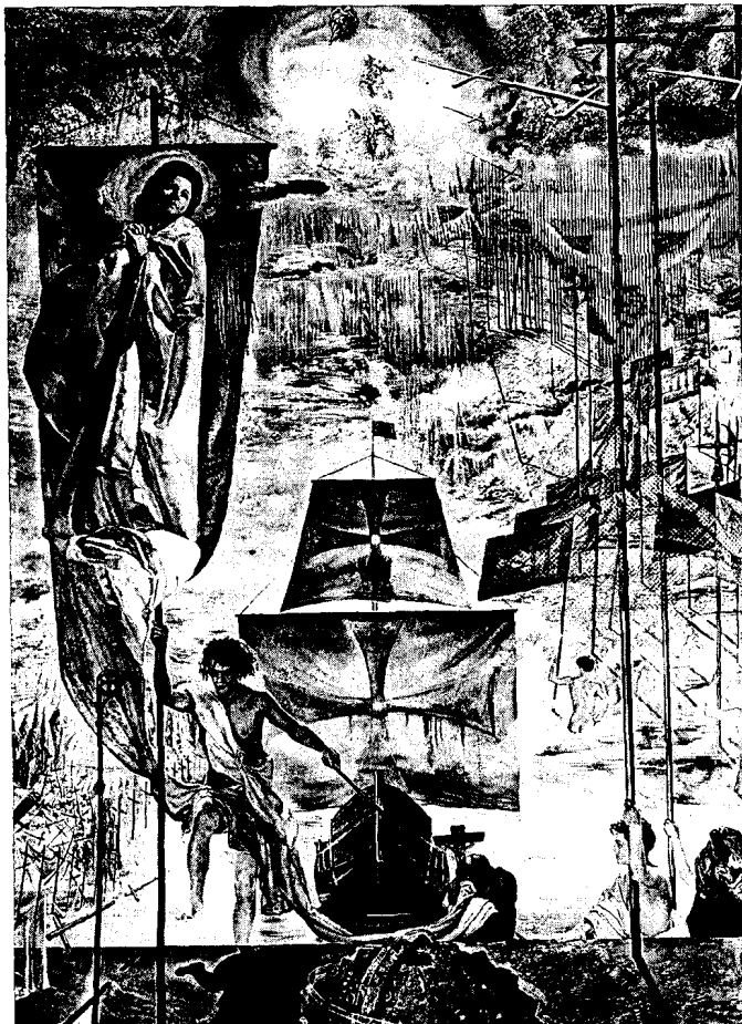
"El somni de Cristòfor Colom", una de les grans obres mestres de Salvador Dalí

«La nau Santa María , llamada antes Marigalante o Maria Galante , era propiedad de Juan de la Cosa, natural