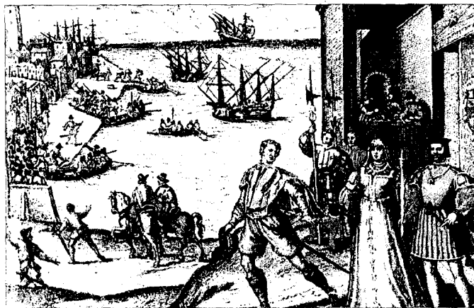
Un gravat que representa la possible sortida de Colom del port de Pals

de Santoña (Santander), que se dedicaba con ella al comercio marítimo. La Marigalante fue construida en algún puerto del Cantábrico. O, según determinadas versiones, en alguno de Galicia, razón por la que muchos la llamaban la Gallega . De la Cosa, tras ceder esta embarcación a Colón, junto