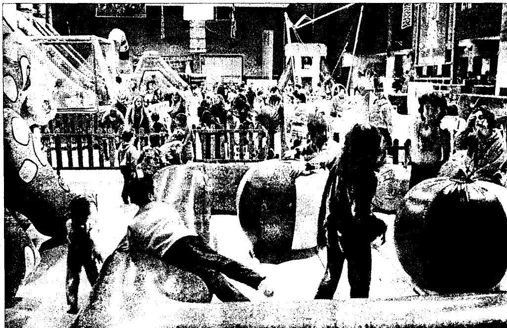
Alguns inflables del parc infantil de Nadal de Castelló d'Empúries i a sota la zona de psicomotricitat

El monitoratge estiuenc es reuneix per les vacances de Nadal i preparen un munt d'activitats per als més petits del poble. En el casal de Nadal es fan jocs, tallers,