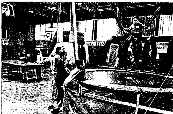
Nens jugant al Parc Infantil de Llançà ubicat al poliesportiu