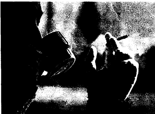
Un home fuma una cigarreta en un bar, una imatge que deixarà de ser habitual a partir de l'1 de gener, quan entri en vigència la llei contra el tabac. / EFE.

La meitat dels restaurants enquestats crearan espais per a fumadors i per a no fumadors. La gran majoria aprofiten la mateixa distribució del local en diverses sales i només hauran de fer inversions en sistemes de ventilació. Pocs optaran per fer obres. Només una trentena han decidit convertir-se en espais sense fum. La gran majoria perquè la seva clientela són famílies amb mainada i d'altres perquè pensen que, d'aquí a poc temps, no es podrà fumar en cap local públic. Però hi ha un sector important que encara no sap què farà (tenen vuit mesos per adaptar-se a la normativa). Primer volen veure com accepta el client aquests canvis i quina és l'opció que afecta menys la caixa. A les pàgines següents s'ofereix la llista de restaurants enquestats.