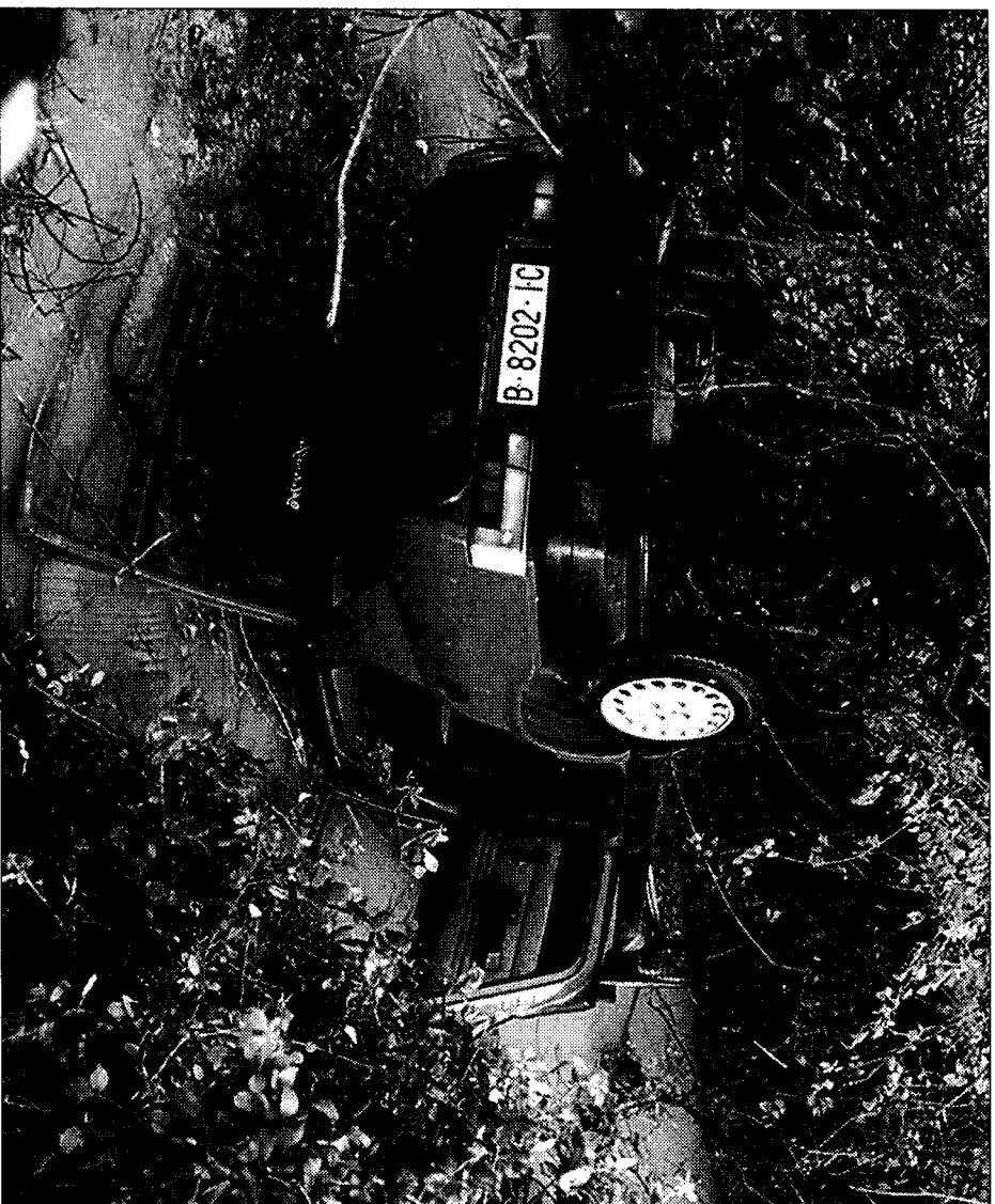
EL COTXE BOLCAT. El vehicle que conduïa l'home marroquí va passar per sobre de l'altre i va anar més lluny.