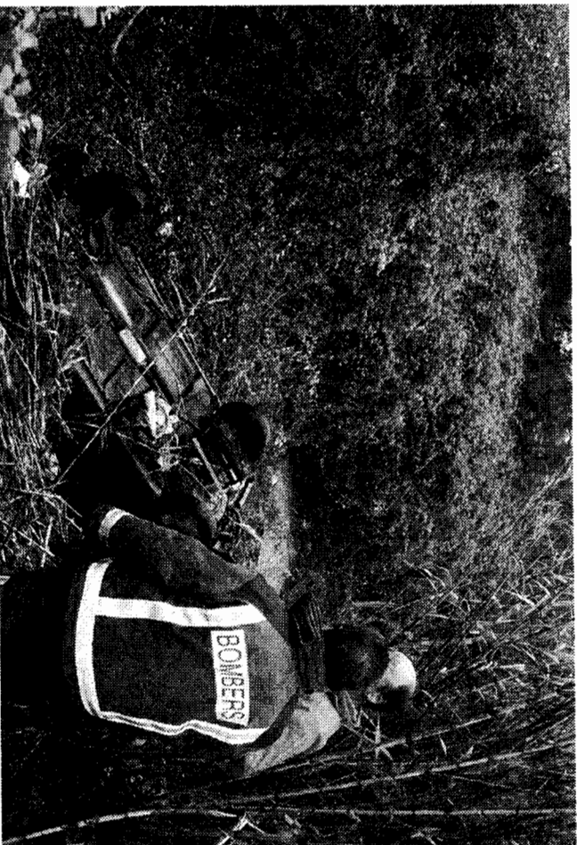
A l'esquerra, un dels cotxes bolcats al mig del rec. Al costat, la grua treu un dels vehicles pel passallís on va haver-hi l'accident, a la carretera que comunica Pedret i Marçà amb Castelló d'Empúries.