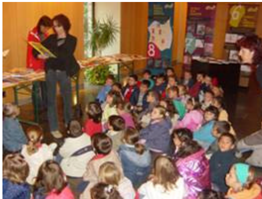
Visita dels alumnes de P5 del CEIP Ruiz Amado a l'exposició de la biblioteca Ramon Bordas i Estragués

Els volums, publicats en anglès, recullen totes les espècies d'aus del món seguint una classificació sistemàtica, utilitzant dibuixos i fotografies, indicant la seva situació actual, incloent-hi referències a les subespècies i incorporant mapes amb les zones de distribució.