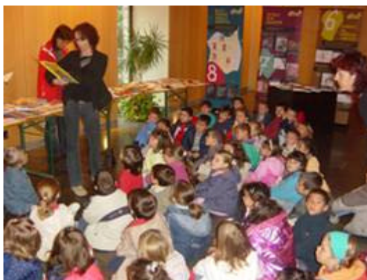
Visita dels alumnes de P5 del CEIP Ruiz Amado a l'exposició de la biblioteca Ramon Bordas i Estragués

Els volums, publicats en anglès, recullen totes les espècies d'aus del món seguint una classificació sistemàtica, utilitzant dibuixos i fotografies, indicant la seva situació actual, incloent-hi referències a les subespècies i incorporant mapes amb les zones de distribució.