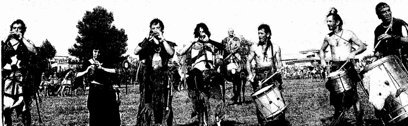
El torneig medieval es fa dissabte a la tarda al Camp d'en Capella; aquest escenari és ideal per la seva amplitud i pels bons accessos tot i que queda bastant apartat del centre històric