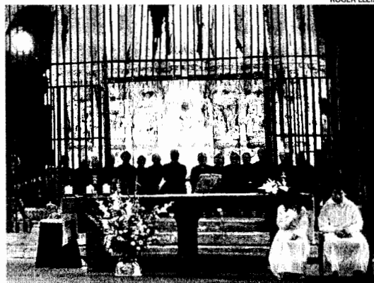
A l'interior de l'església de Santa Maria s'hi duen a terme nombrosos actes

La construcció de l'església de Santa Maria de la Candelera de Castelló d'Empúries va implicar tant els esforços dels comtes com del mateix poble. La intenció era recuperar l'antic bisbat emporità cosa que no va succeir mai. Malgrat això, es va aixecar un temple de dimensions impròpies per a una església parroquial. Ara, s'ha presentat documentació perquè l'Església la catalogui com a Basílica Menor i així poder accedir a subvencions i ajudes per protegir i restaurar aquest patrimoni col·lectiu que amaga importants trossos.