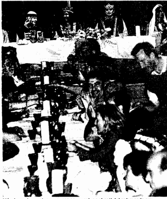
Més de quatre-centes persones es reuneixen al pati del palau cada any