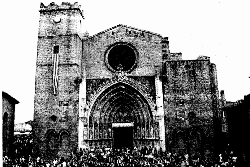
Coneguda com a la catedral de l'Empordà, l'església de Santa Maria centra la temàtica d'enguany del Festival

Les xerrades de la UdG estan dedicades a les Catedrals Foren recintes simbòlics i un impuls tecnològic i artístic Tots els actes tindran lloc a la Sala Gòtica