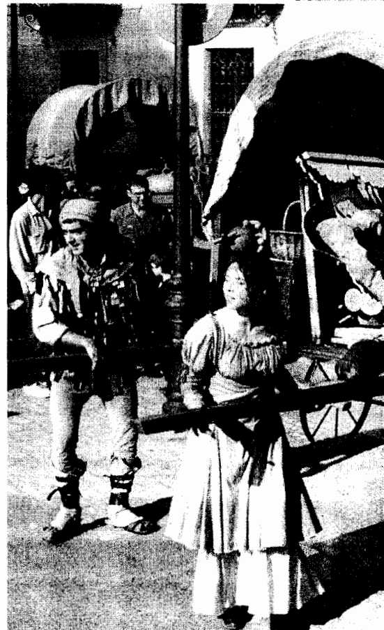
La Cremallera Teatre presenta tres muntatges diferents al festival

Per les propostes de La Cremallera Teatre no seran les úniques que amenitzaran els carrers del nucli històric. El públic també podrà gaudir amb les actuacions musicals i teatrals dels Berros de la Cort, Acibreira, Rodamons, Pa Sacat, Excalibur i Sold&Ats. Algunes d'aquestes formacions, especialitzades en medievals, són ben conegudes pel públic del festival.