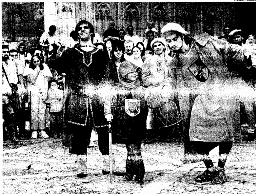
Als carrers de Castelló d'Empúries s'omplen de bullici els dies que dura el festival Terra de Trobadors

La 15a edició del Festival arranca dijous fins diumenge Les entitats locals potencien la seva participació impulsant actes L'actuació de Ma. del Mar Bonet serà un dels plats forts