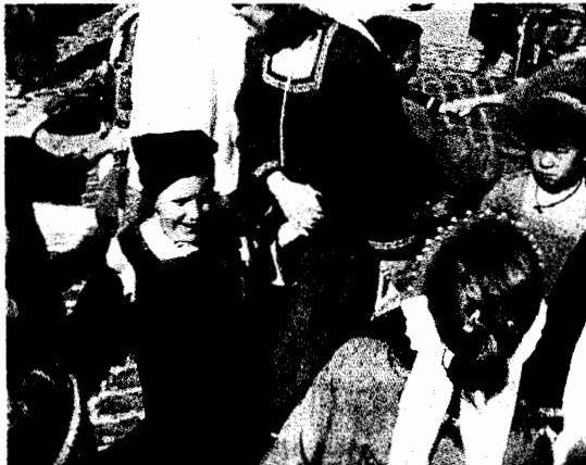
Els més petits podran gaudir amb els jocs tradicionals del poblat

que emula els antics campaments que hi havia fora muralles destinats a acollir la gent més pobre de la societat però també a alguns artesans com ara els picapedrers. Quan sigui l'hora de menjar, el so d'una